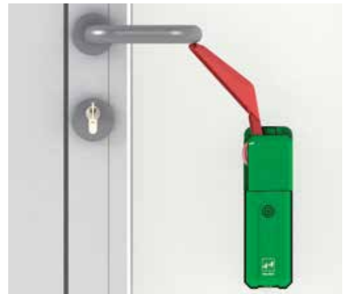
Montage auf Vollblattrtüre