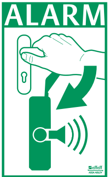
Warnschild gegen Missbrauch

Alarm bei missbräuchlicher Benutzung eines Notausgangs: eine Betätigung des Türdrückers wird akustisch und optisch angezeigt. Durch seine Positionierung bildet der EXITalarm 7411 eine visuelle Hemmschwelle gegen unbefugtes Benutzen der Tür. Mit einer 9 V-Batterie als Spannungsversorgung ist es das ideale Produkt für eine Nachrüstung ohne die sonst notwendige Verkabelung.